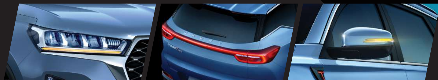
Daytime Running Lamps and LED Headlamp with Electric Height Adjustment

Exterior dengan tampilan yang sporty dan modern, sehingga meningkatkan kepercayaan diri di manapun dan kemanapun Anda berkendara.