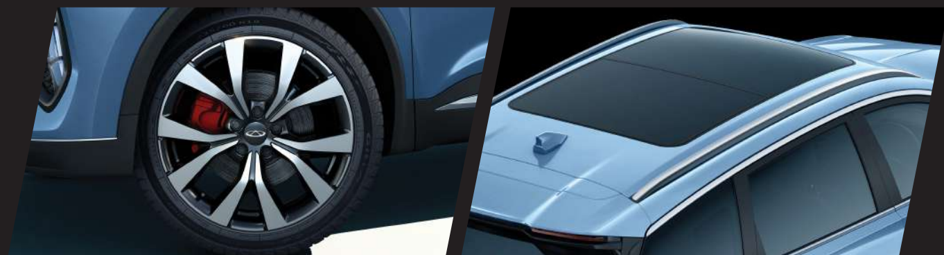
18" Two Tone Alloy Wheel