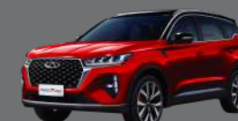
Two Tone - Red Ruby Black