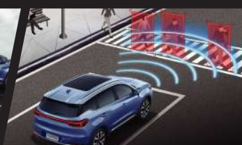
Front Collision Warning (FCW) with Vehicle Identification