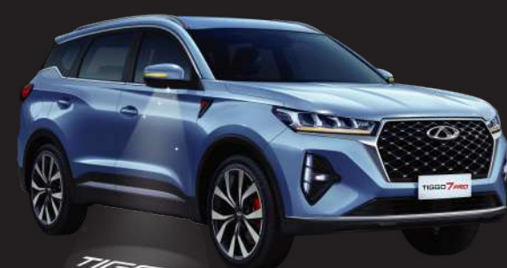
Fashion Lighting Lamp with Tiggo Logo