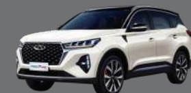
Two Tone - White Howlite Black