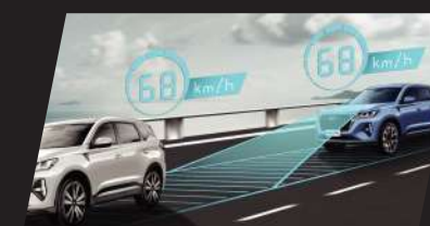
Adaptive Cruise Control (ACC) with Low Speed Follow