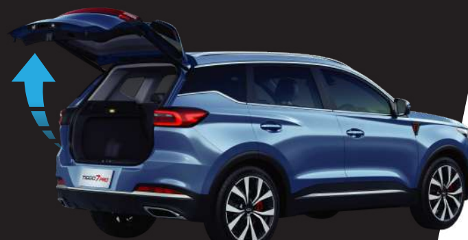
Sensor & Electric Reardoor Trunk with Height Adjuster Trunk Capacity : 475 L