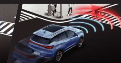
Autonomous Emergency Braking (AEB)